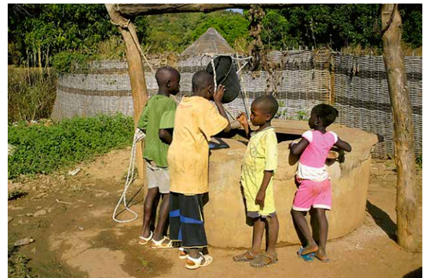
Kinder am Brunnen

kollektiver Solidarität, sowohl auf nationaler als auch auf internationaler Ebene.