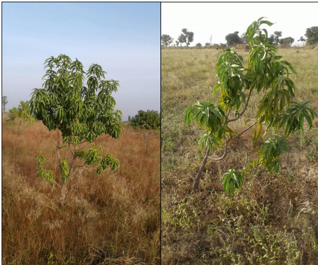
Mangobäume im Wachstum (3 – 4-jährig)

Es wird eine wichtige Aufgabe des Beiratsforums sein, sich Gedanken um den Unterhalt und die Weiterentwicklung der Mangoplantagen zu machen. Diese sollen in Zukunft eine wesentliche Finanzierungsquelle für die weitere Entwicklung des Dorfes sein, besonders wenn sich die Hilfswerke anderen Projekten widmen.