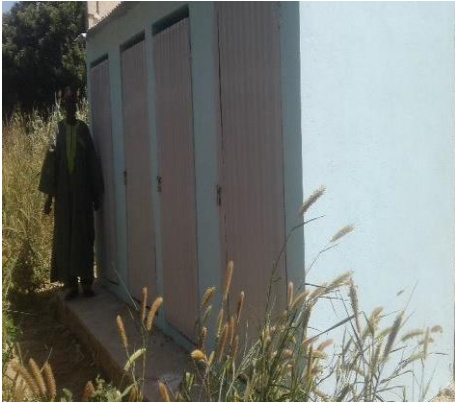
Sanitäranlage des Priesterhauses