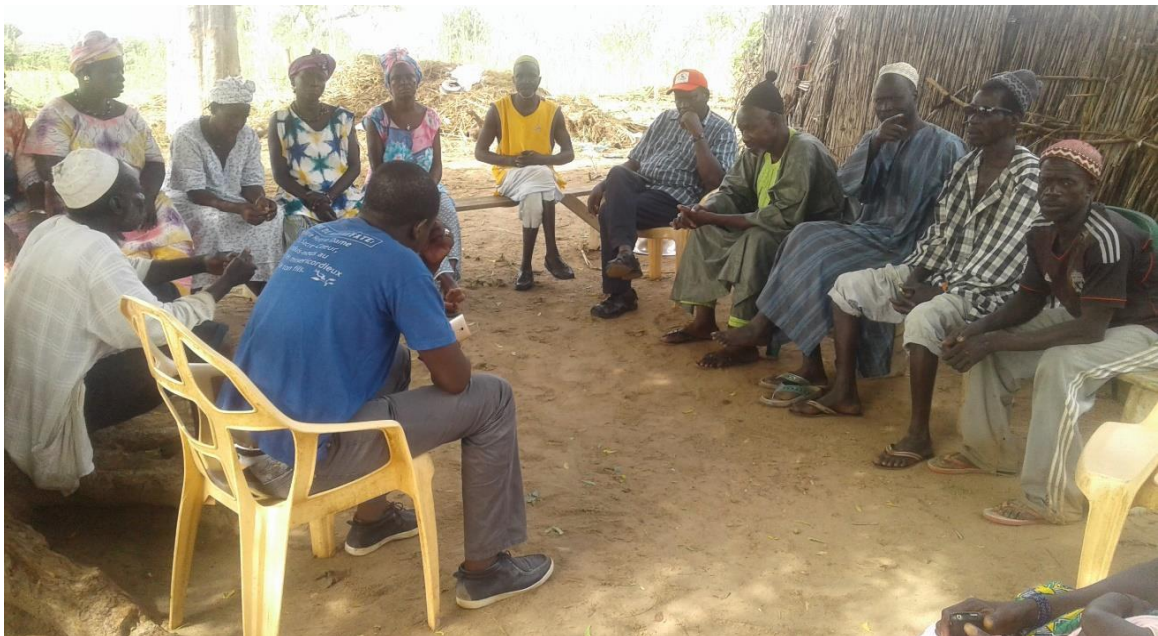
Treffen wegen dem Antisalz-Damm