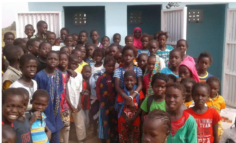
Die Kinder freuen sich über die Anlage und danken Hand für Afrika