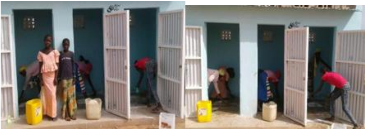
Die Schüler/Innen unterhalten ihre Sanitäranlage