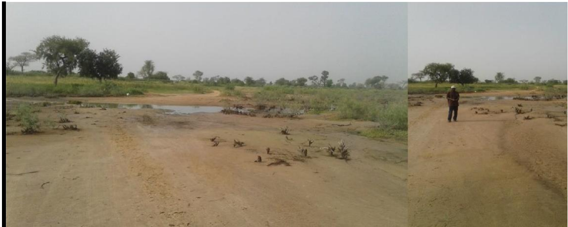
Ort für den Bau des Antisalz-Dammes